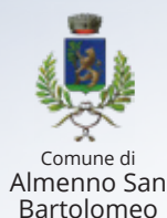
Comune di Almenno San Bartolomeo

Con l'adesione e il contributo dei Comuni dei Sistemi Bibliotecari dell'Area di Dalmine e dell'Area Nord-Ovest della provincia di Bergamo